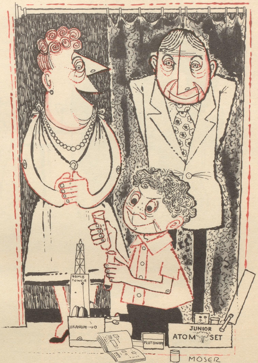
In USA werden Atom-Spielzeuge verkauft