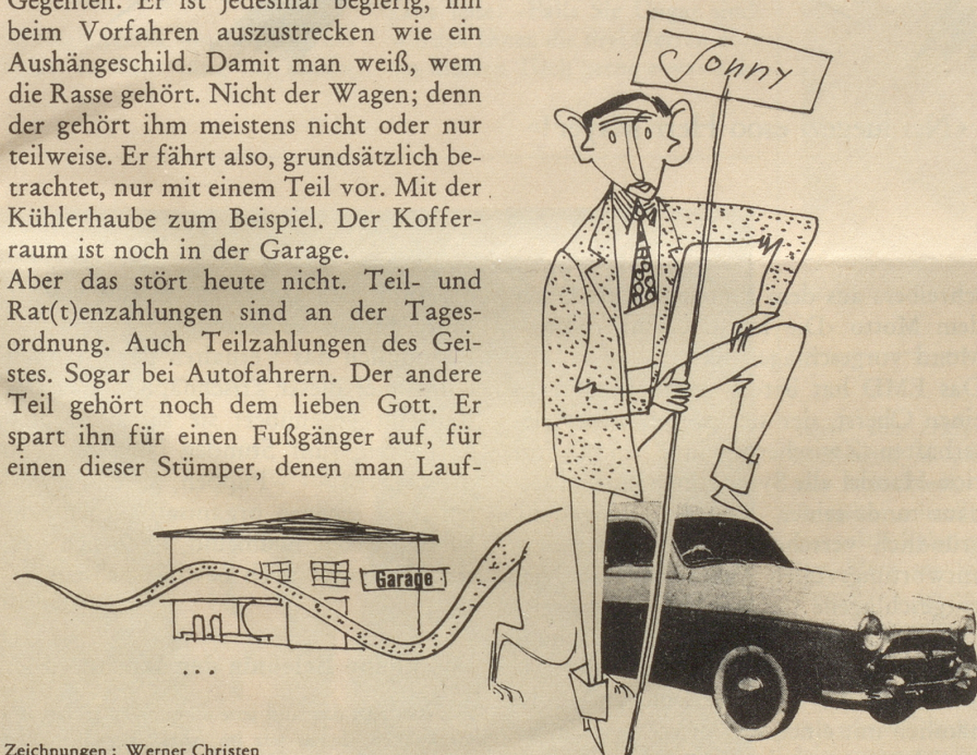
Zeichnungen: Werner Christen