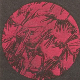
(Mikrofoto der Glutaminsäure in Kristallform)