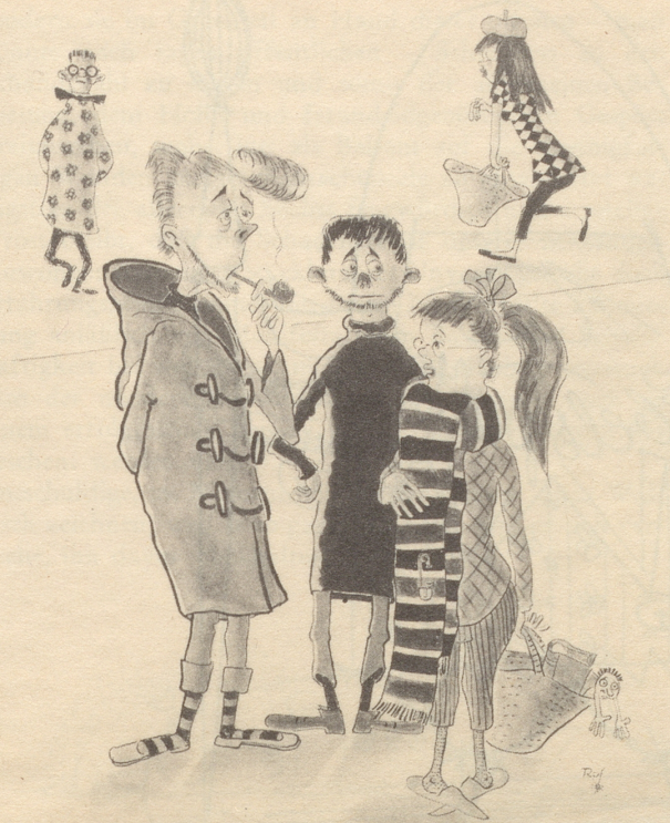
Probleme der Halbstarcken «Was lege mir an dr Fasnacht aa?»