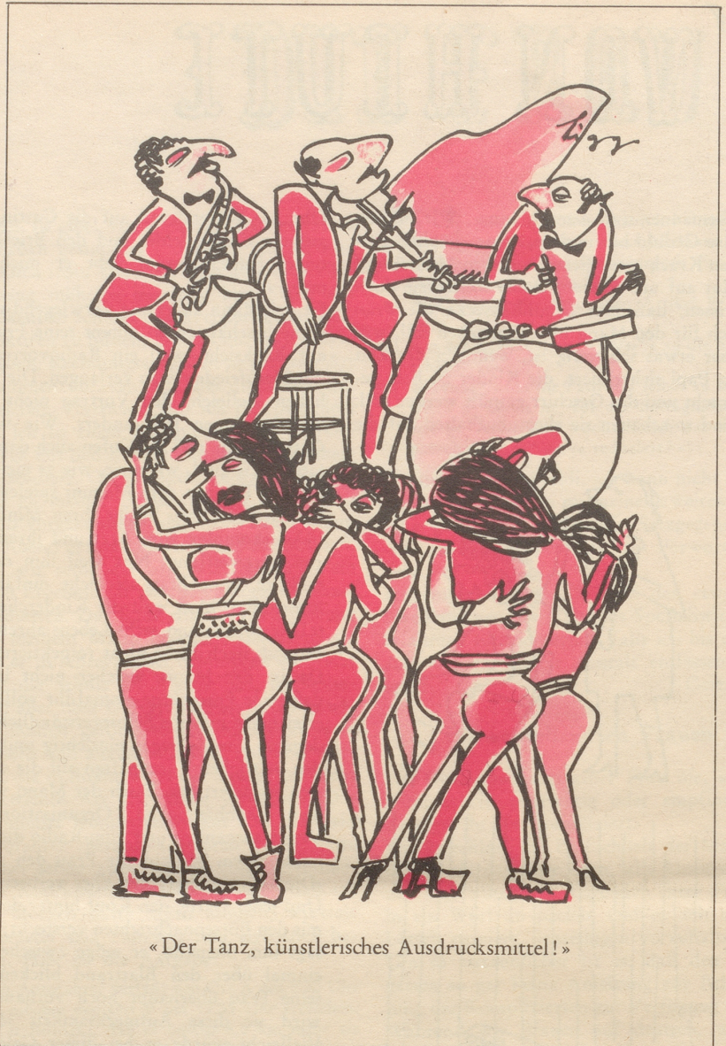
«Der Tanz, künstlerisches Ausdrucksmittel!»