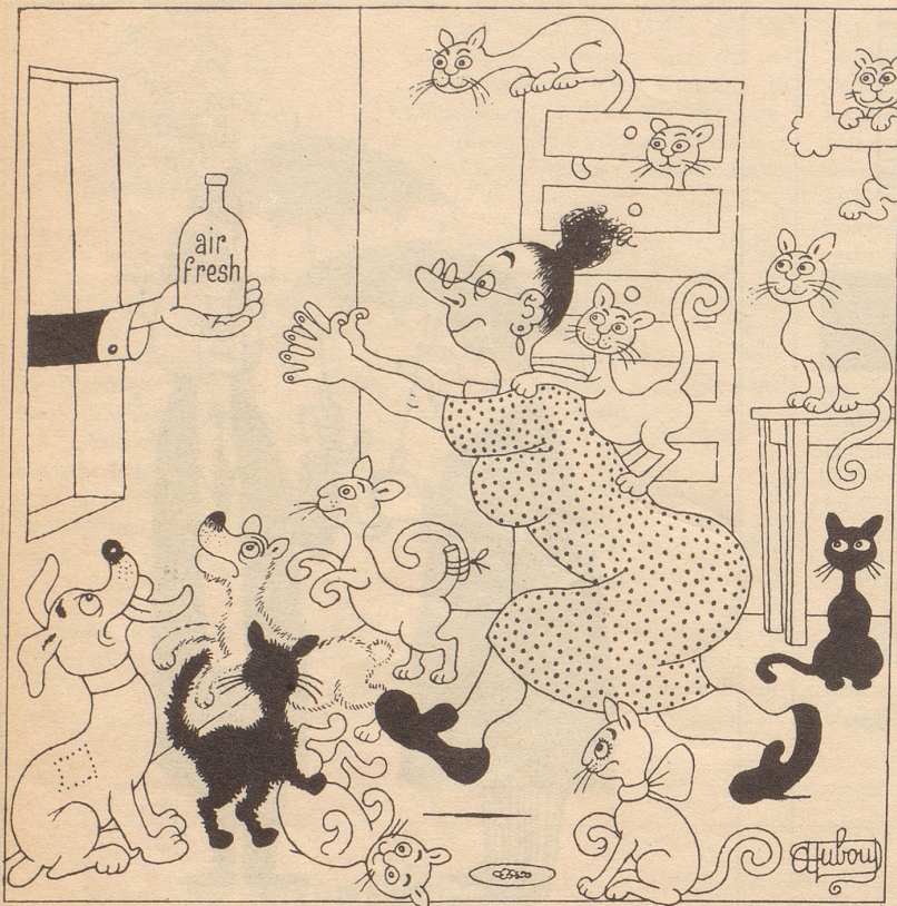
Glücklich ist, wer air-fresh kennt.