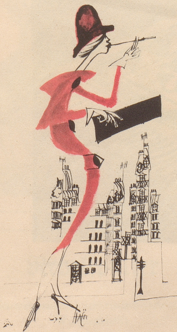
Die modische Haltung für 1958

Jetzt Lebewohl auch flüssig, speziell gegen Warzen.