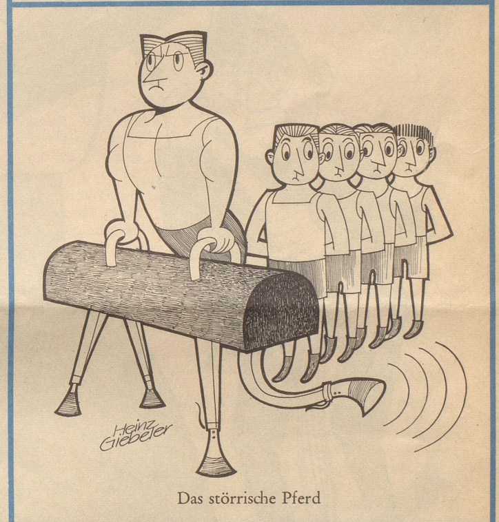
Das störrische Pferd