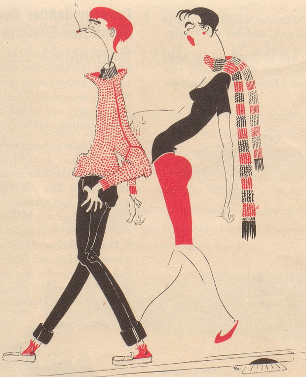
Läberwäse am Schtraßerand

«Jacky, kontrollier dini Haltig, mir wärded beobachtet.»