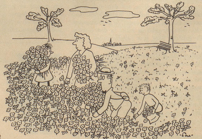
Menschen über der Flur!

«Sie müssen uns unbedingt besuchen, wenn Sie nach Z. kommen.» «Nehmen Sie doch noch, es hat noch viel Poulet in der Küche.» «Ich habe dreimal versucht, Sie anzurufen, aber es hat niemand geantwortet.» «Wir haben Ihnen eine Karte aus Sizilien geschrieben, aber sie muß unterwegs verloren gegangen sein. Meine Schwägerin hat die ihre auch nicht bekommen.»