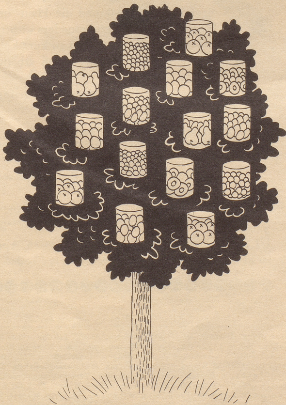
Der Idealbaum der modernen Hausfrau