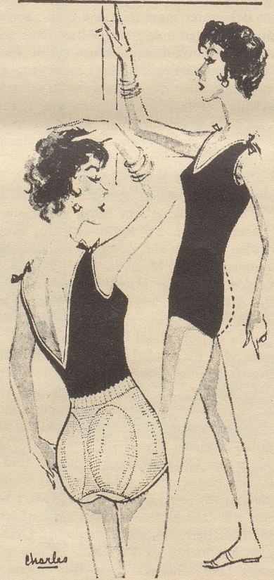
CURVACIOUS CURVES for the "string bean" figure are beautifully achieved by this new panty girdle with "built-in upholstery." Removable seat pads do the trick. Sizes are small, medium, large, at $8.50.

Motto: Haare - Zähne, selbst der Busen Werden abgelegt zum Pfsen. - Doch im Strandbad girlie (Wanda) Machet dreist in Popo ganda.