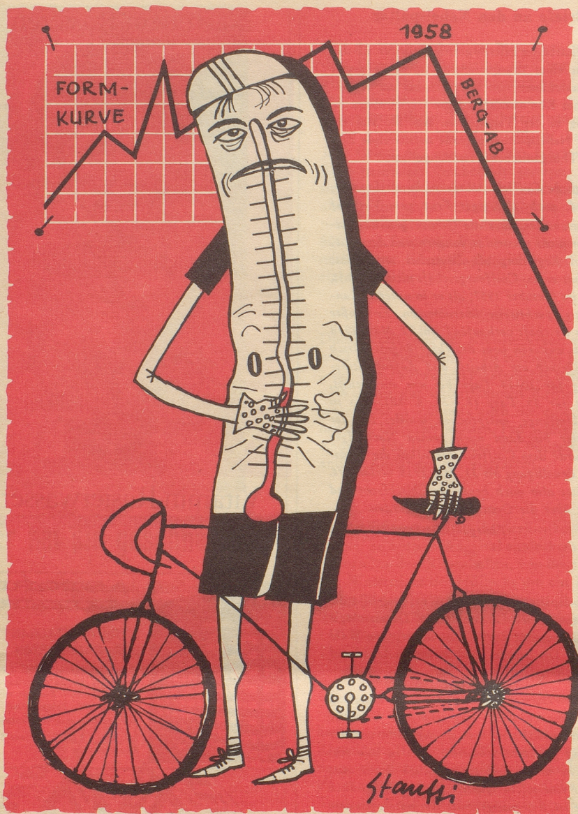
Frühjahrsmüdigkeit im Schweizer Straßenradspport!