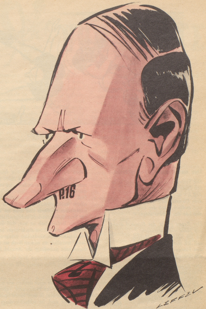
Das Portrait der Woche: Mr. «P-16»