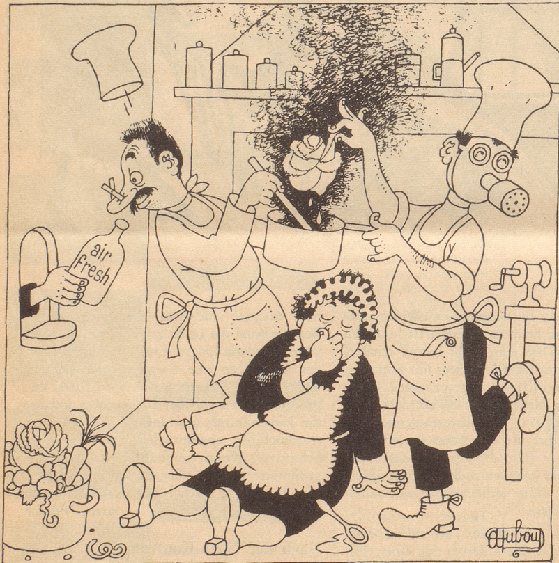
Glücklich ist, wer air-fresh kennt.

Kein Wohnhaus, noch so moderner Bau-Art, kann sich so kostspielige Einrichtungen leisten. Da ist die Hausfrau nach wie vor aufs Fenster angewiesen. Während der Kochzeit steht das Fenster offen – auch in Herbst und Winter. Schnupfen, Katarrh, Rheumatismus halten leichten Einzug. Und die Kälte dazu. Warum eigentlich? Es gibt ja air-fresh! Für wenig Geld sparen Sie viel Heizungskosten und schaffen sich mit air-fresh eine so angenehme Atmosphäre wie in einer Erstklass-Küche eines Grand-Hotels. air-fresh hilft auch Heizkosten sparen. Gerade während der kalten Jahreszeit wird air-fresh besonders geschätzt, denn es macht allzu häufiges Lüften, das stets auf Kosten der Wärme und Gemütlichkeit geht, überflüssig.