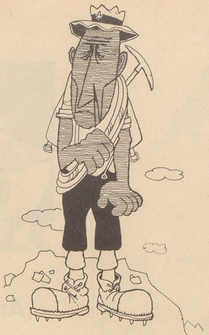
Berge und Menschen