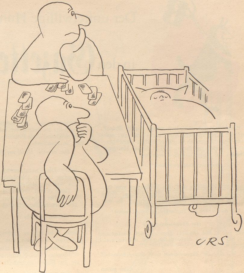
Sie warten auf den dritten Mann

Bezugsquellennachweis: E. Schlatter, Neuchâtel