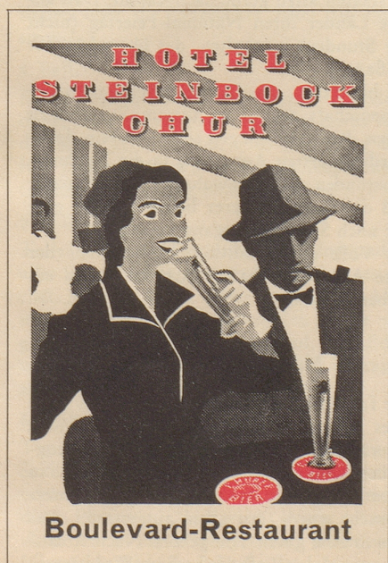
Läbewäse am Schtraaßerand

Ein Kino in Pretoria (Südafrika) hat zur Bequemlichkeit seiner Besucher eine Waschanstalt anbauen lassen. Die Hausfrauen bringen ihre schmutzige Wäsche mit und lassen sie waschen, während sie sich den Film ansehen.