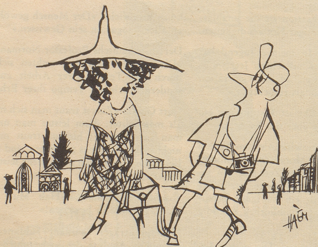
Pisa werde ich nie vergessen