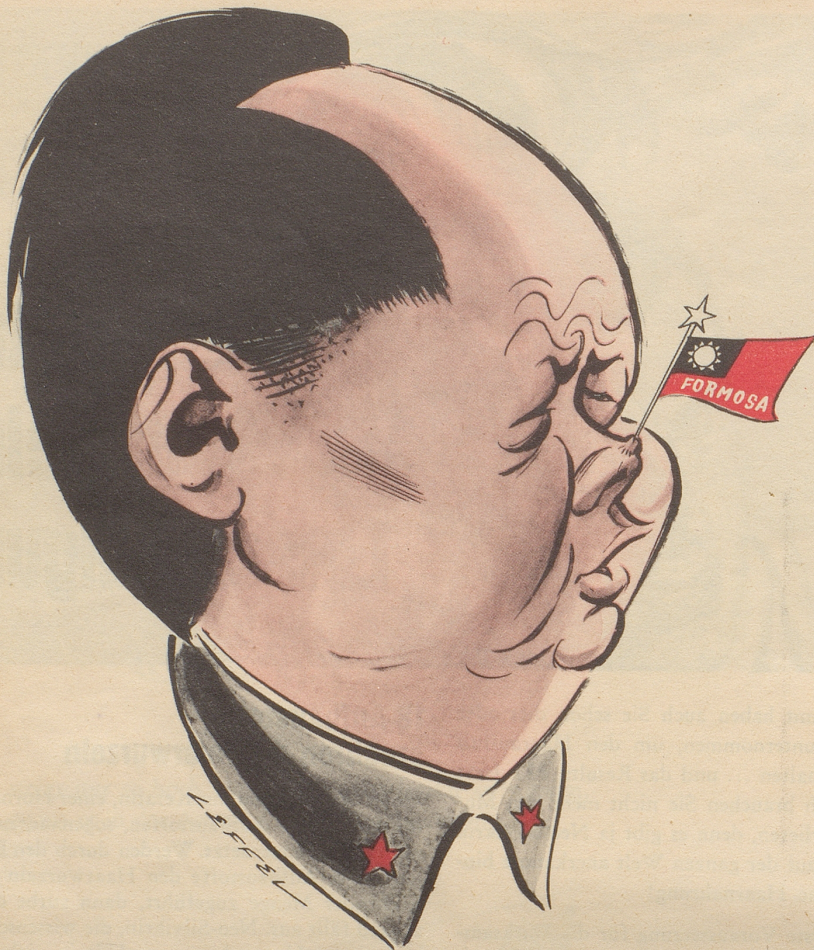
Das Portrait der Woche: Mao-Tse-Tung