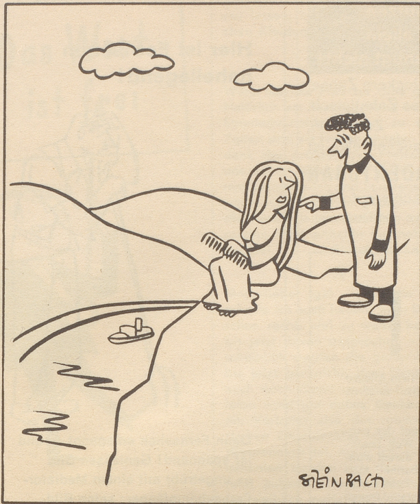
«Äxgüsi darf ich Ihnen eine moderne Kaltwelle legen?»