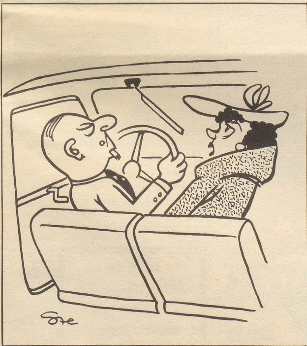
«Gib nid sovill Gas Kasimir süsch wird dGasrächnig zhöch!»