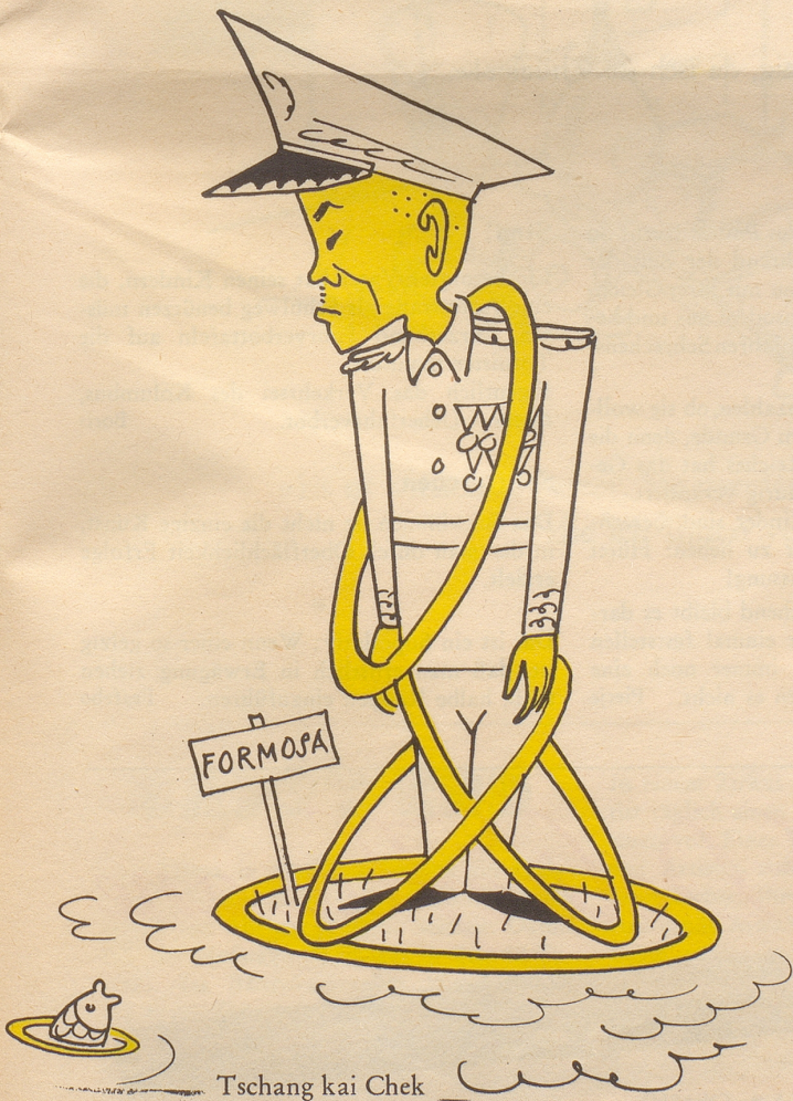
Tschang kai Chek