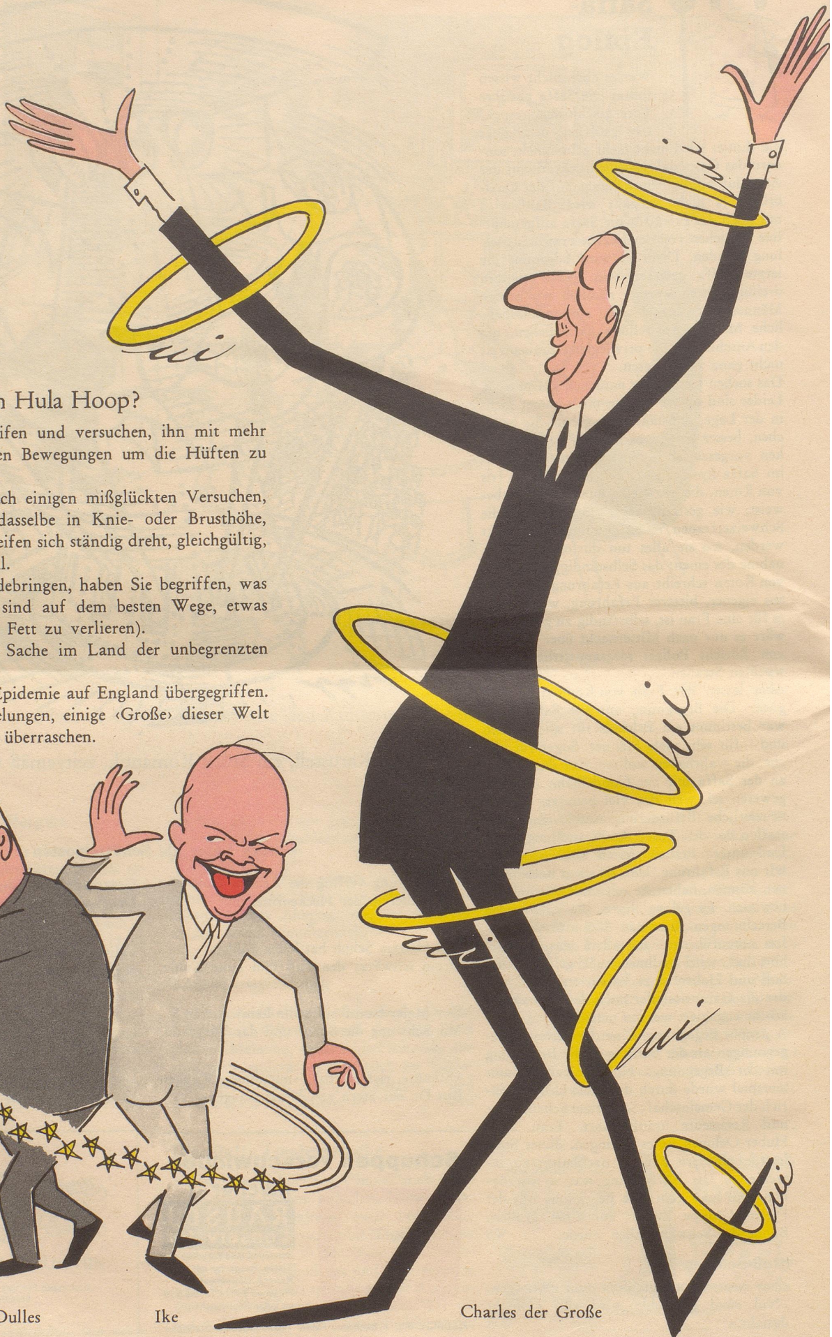
Charles der Große