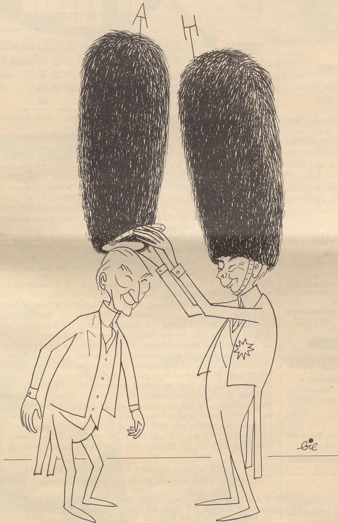
Heuss bringt Adenauer Souvenir

Ein Zehnjähriger brachte in eine Filiale der N.Y. Public Library sein überfälliges Buch zurück. Als ihm die Bibliothekarin zwei Cents Strafgebühr abverlangte, fragte er sie treuherzig: «Können Sie wirklich davon leben?»