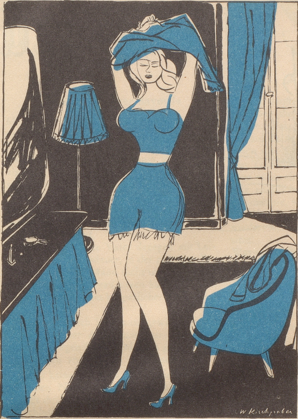
«Sovill ich vo de Geometrie versctaa, lat sich de Inhalt vo dere Trapez-Mode nu bewiise dur sNégligé.»