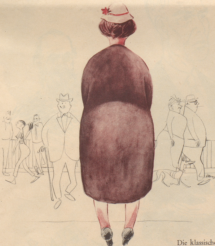
Die klassische Linie

Der Schriftsteller Boris Pasternak hat aus freiem Willen auf den Nobelpreis verzichtet. Aus Chruschtschews freiem Willen.