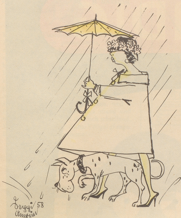
Jede Mode hat ihr Gutes!