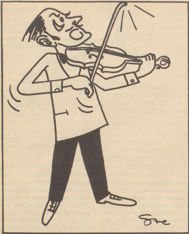
Es ist des Zeichners Schuld!