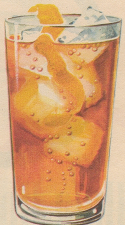
On the Rocks Ein mit Eiswürfeln bis an den Rand gefülltes Normal-Whiskyglas mit 40-50 gr. Four Roses Bourbon Whisky übergießen. Je nach Wunsch mit Sodawasser auffüllen u. dann eine Zitronenspirale dazugeben.