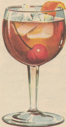
Manhattan 2-3 Tropfen Angostura-Bitter, 1 Teil italienischen Vermouth und 2 Teile Four Roses mit Eis im Shaker mischen, auf eine Kirsche in ein Cocktailglas abfüllen. Orangenschale, wenn gewünscht, hinzufügen.