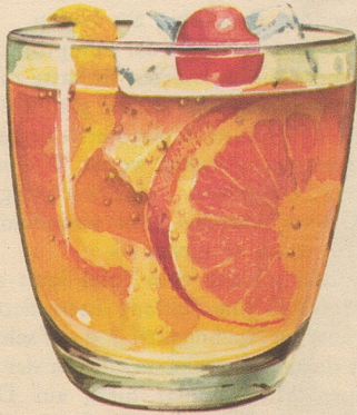
Old Fashioned 1 Teelöffel Wasser, 1 Stück Würfelzucker mit 2-3 Tropfen Angostura-Bitter, viel Eis, 40-50 gr. Four Roses darübergießen, mit Zitronen- und Orangenscheiben garnieren, obendrauf eine Maraschino-Kirsche.