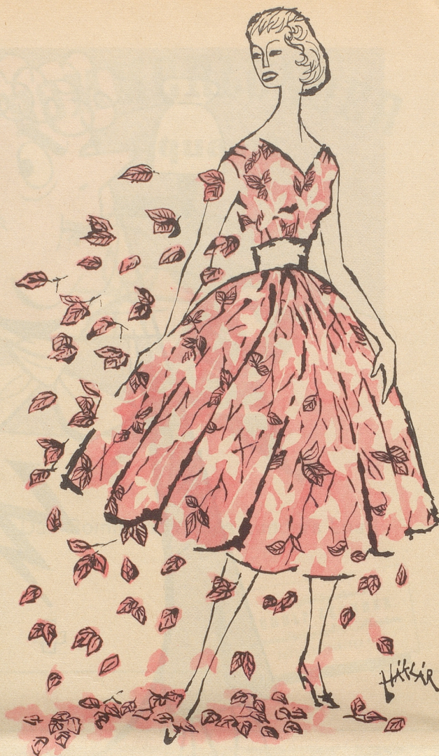
Das Spätherbstkleid mit dem naturalistischen Dessin