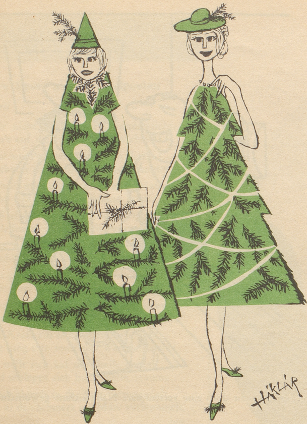
Warum nicht auch das noch?!