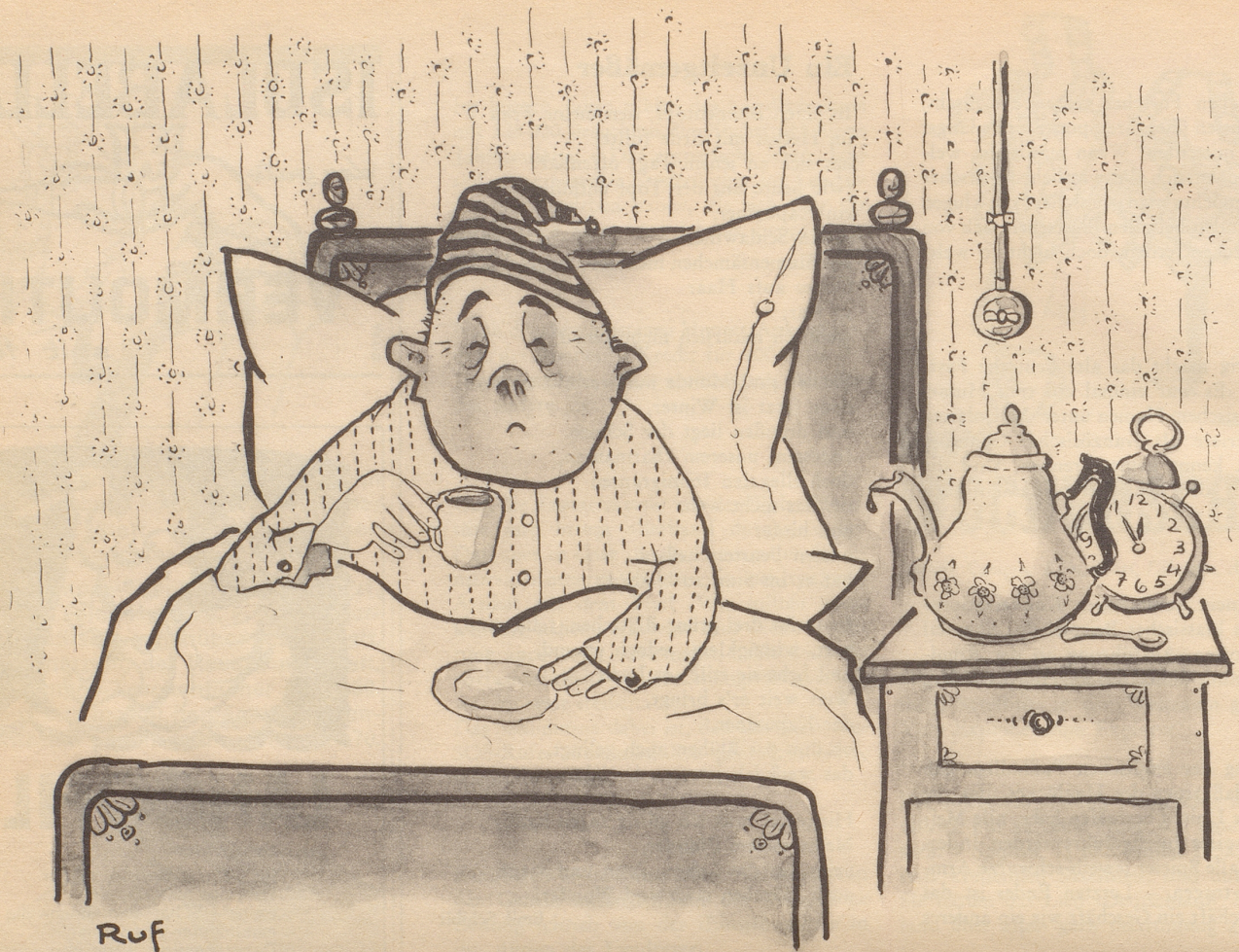
Em Zürcher sis Nachtcafé