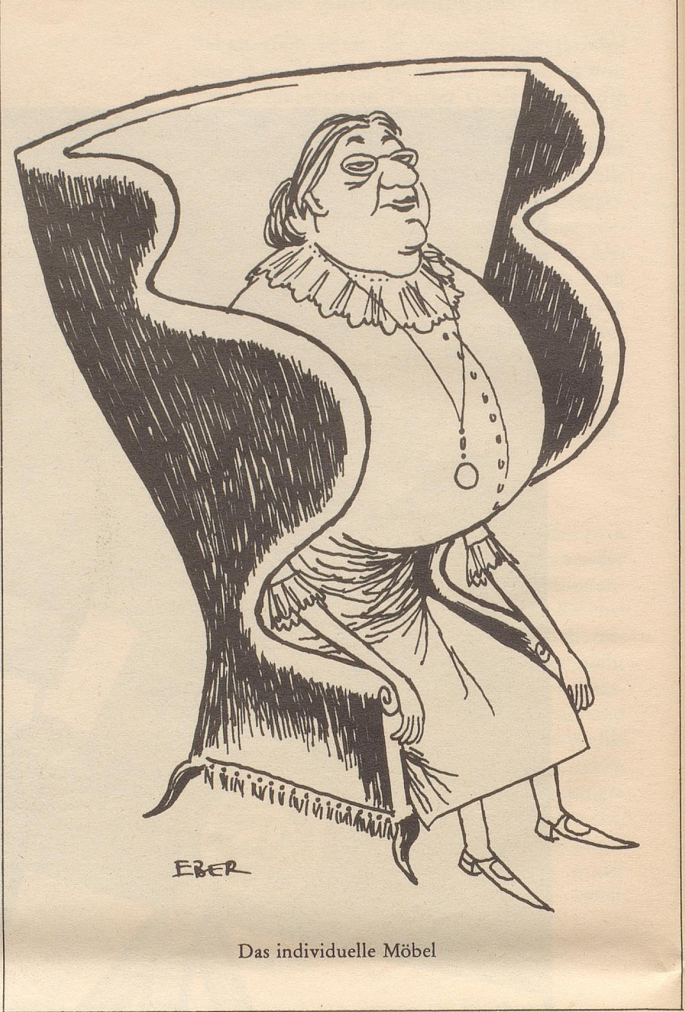
Das individuelle Möbel

Waagrecht: 1 hat Götterpflichten zu erfüllen; 2 ????; 3 menschlicher Erfindergeist macht daraus Atombomben; 4 ?????; 5 dort be- oder entsteigen Stadtzürcher der SBB; 6 eines der über 5000, in welchem Franzosen in Adelboden schlafen können; 7 25 waagrecht kann in Reihen an ihren Rändern stehen; 8 französisches Fürwort; 9 und 10 ?????????; 11 ???; 12 kurz für Rekrutenschule; 13 und 14 ?????????; 15 Jugendname des Inn; 16 die Italiener mußten sie mit den übrigen Dodekanesinseln an Griechenland abtreten; 17 ???; 18 ?????; 19 ?????; 20 steht auf Windrosen gegenüber WNW (Abkürzung); 21 lebt in Karsthöhlengewässern; 22 und 23 ?????????; 24 Ortschaft im st. gallischen Unterrheintal; 25 siehe 7 waagrecht; 26 der Eiserne Vorhang trennt ihn von seinem finnischen Nachbarn; 27 ?????????; 28 Komponisten schreiben sie auf Blätter; 29 .... -Eisen wird auf keinem Amboß geschmiedet; 30 Gelehrte sind es; 31 Hausfrauen verleidet es, wenn sie dafür zu viel Zeit verplempern müssen; 32 Adelboden ist sein Kleinod. Senkrecht: 1 Kopfwehgeplagte schlucken es und Weidmänner lassen es in Rauch aufgehen; 2 .. Berge sich erheben; 3 wird in Opern gesungen; 4 steht den Gästen von Adelboden von Mitte Dezember bis Ende März zur Verfügung; 5 Bergsteiger besteigen sie in den Karpaten; 6 so notiert der Wetterwart die Himmelsrichtung Ostnordosten; 7 wie 15 waagrecht; 8 Osten (französisch); 9 wer eine Fahrt macht, zieht sie über die Knie; 10 wurde