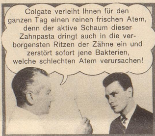
SPÄTER — dank Colgate: