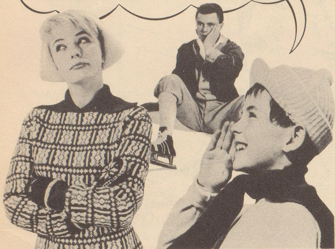
Was Peter erfuhr!