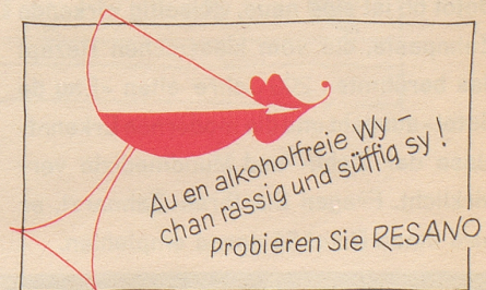
Bezugsquellennachweis durch: Brauerei Uster

nooblar sii und sääga: Feerigescht, wo göönd go fische und nia aswas fangand, söttandi nüüt müassa zaala. Söttigi, wo bejm Fische no dNatuur aaluagand und tüüf schnuufand, hend zwai Schtutz pro Taag zblähha. Und wens zuafellig no sötti Fische ggee, won aswas ussazüühand – nu, mit denna khönnti dar Fischarej-Uufsähhar am Schluß vu da Feerian aprächna!