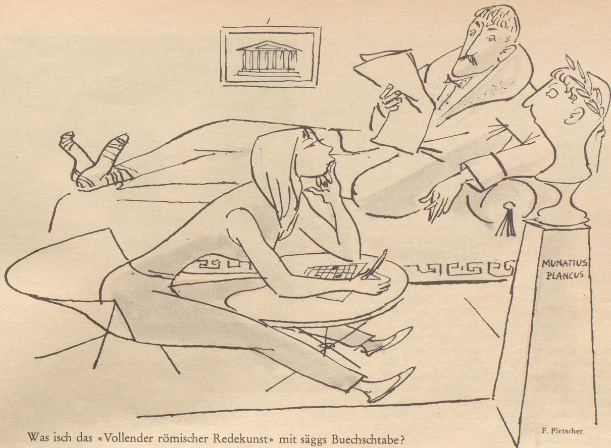
Was isch das «Vollender römischer Redekunst» mit säggs Buechschtabe? Dängg «Waggis»!