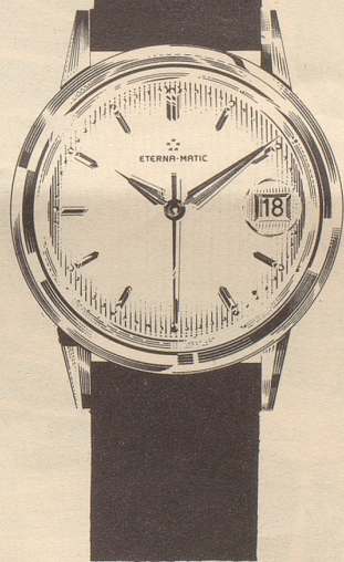
071BT-1422 «Dato» automatisch, wasserdicht versenkte Krone Edelstahl ab Fr. 230.- Goldfront ab Fr. 280.- Goldmantel ab Fr. 330.- 18 Kt. Gold ab Fr. 690.-