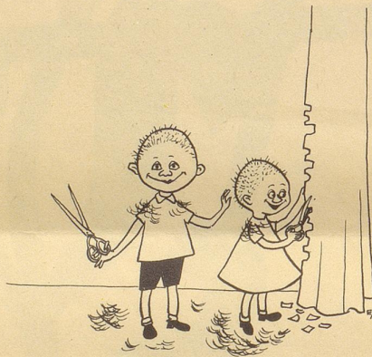
Mer händ nu Coifförlis gschpillt!