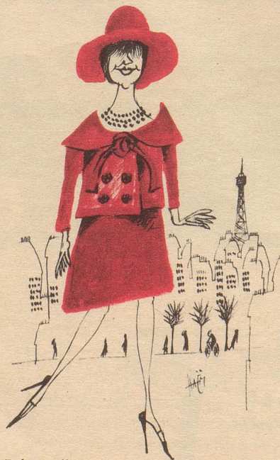
Baby-Doll-Mode für junge Damen über vierzig