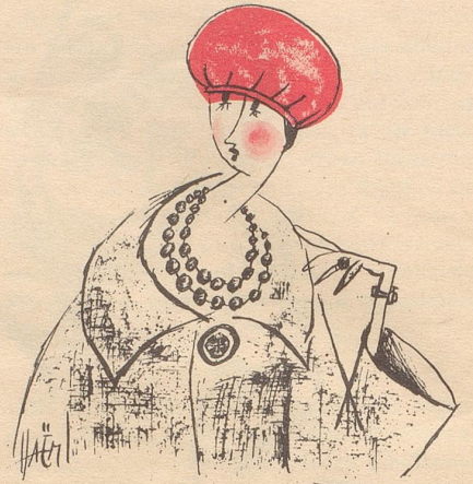
Nouveau stile 1925