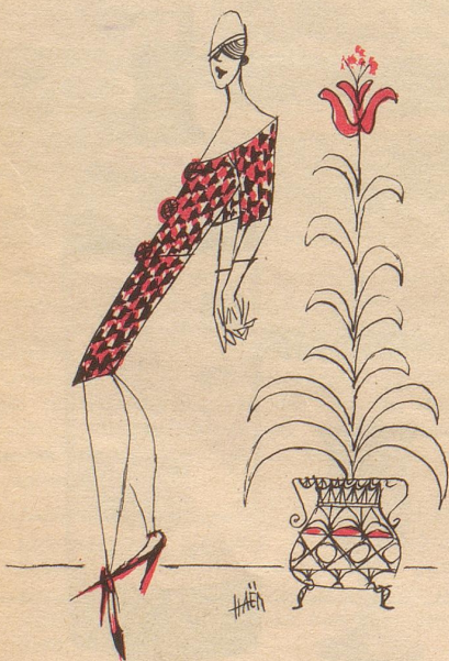
Modische Haltung für 1958