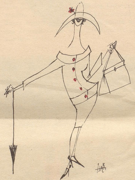
Modische Haltung für 1958