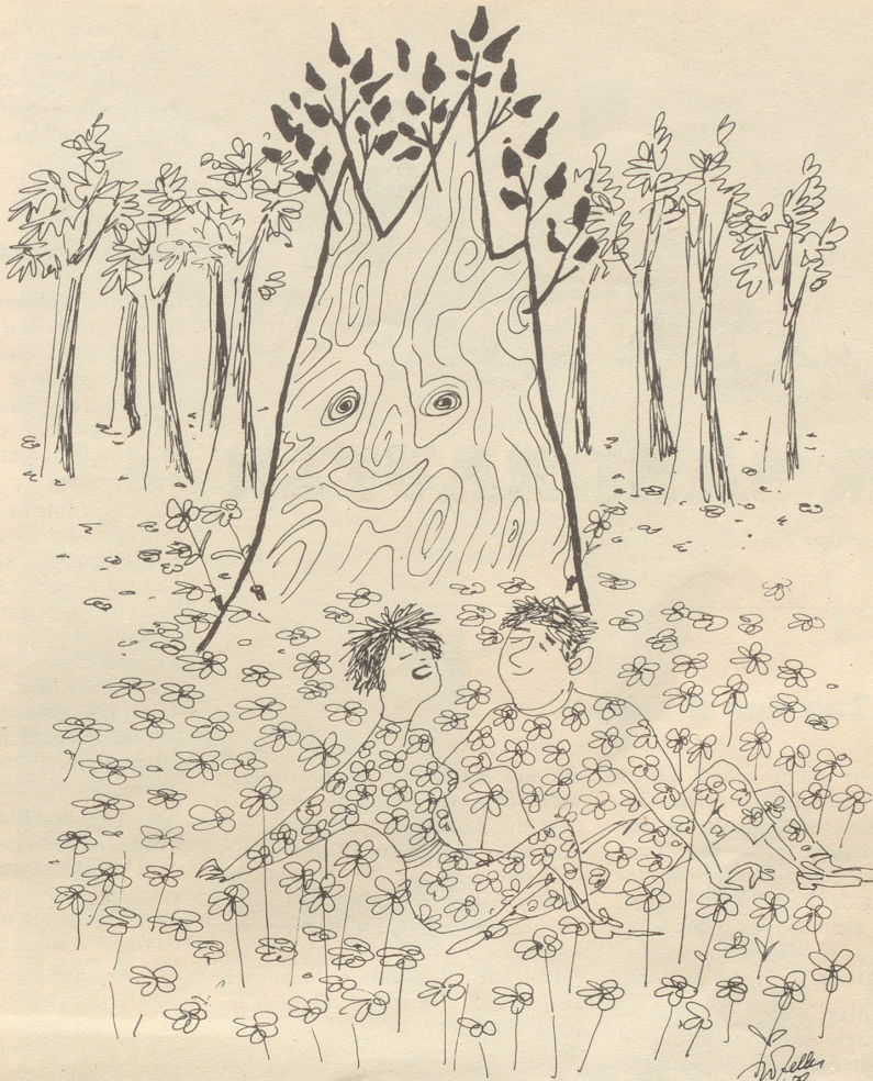
Sporthemden und Blusen mit Wald- und Wiesenmustern werden angepriesen

* Als modärna Dichtar hanni nitt gschrib- ba: Khrokhüssar sind blau, gällb und wüiß. «Blauand gällb und wüiß» töönt viil ele- ganter!