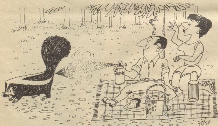
Selbst ein Stinktief würde uns nicht in Verlegenheit bringen