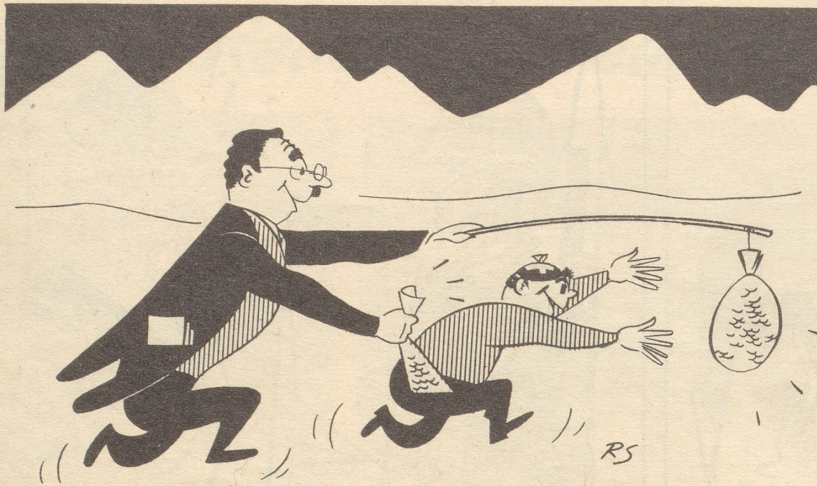
Illustrationsvorschlag für einen Spielbankprospekt