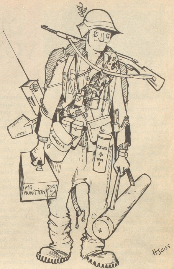
«Gopfriedschtutz mi Hoseträger ...»