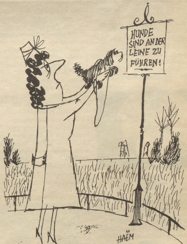
«Geesch Fifi i cha nüüt defür!»