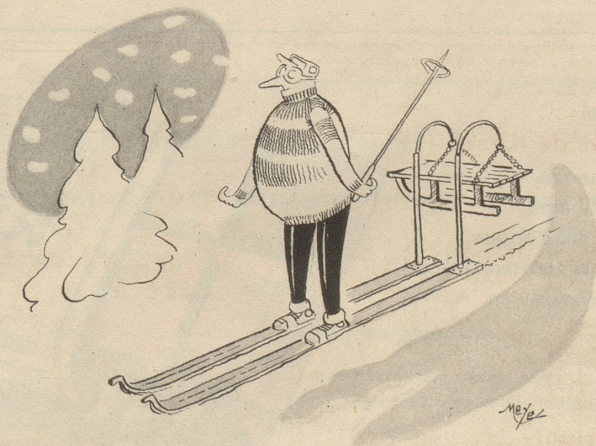
Für alle Fälle

Bei seinem Besuch in Djakarta erhielt Marschall Tito von Präsident Sukarno als Geschenk einen schwarzen Panther. – Was sonst unter Diplomaten nicht üblich ist, hier wurde einmal die Katze aus dem Sack gelassen.