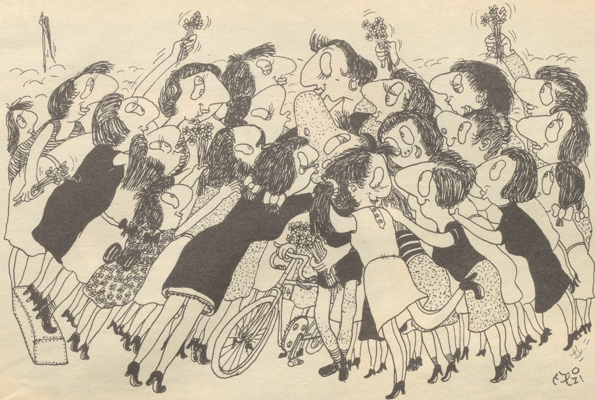
Der Siegeskuß . . .