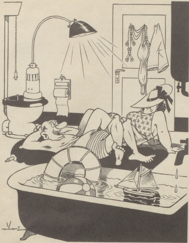
«Hier hat es wenigstens nicht so viele Leute wie am Meer - -»