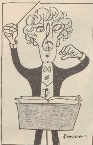
Der Beruf formt den Menschen