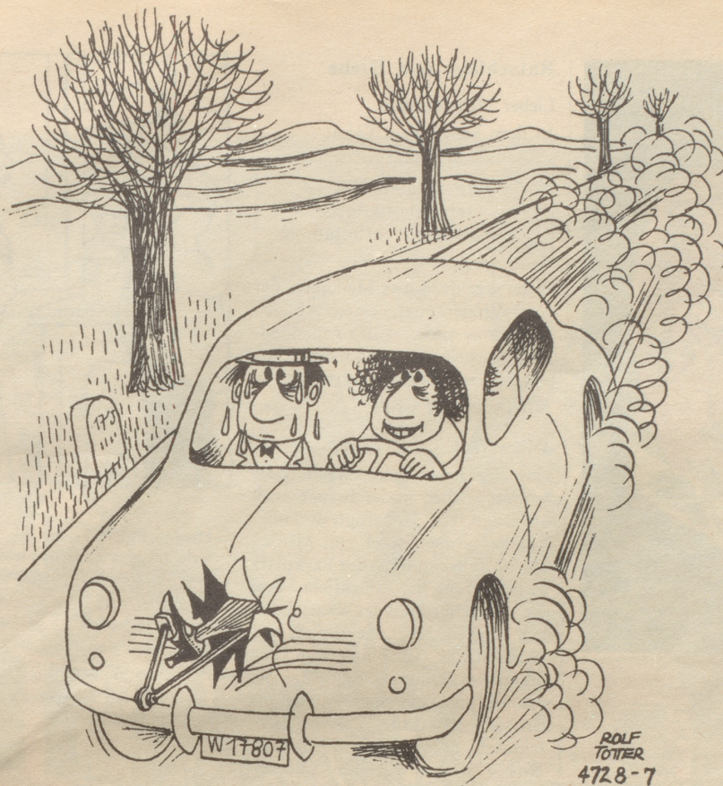
«Gang abem Gas Elisabeth!»