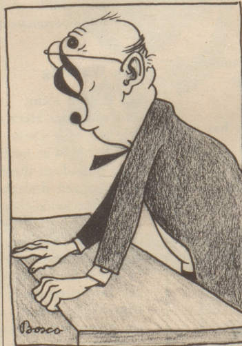
Der Beruf formt den Menschen

Ein Ladenbesitzer in Marseille wirbt mit folgendem Schaufensterschild: «Lassen Sie sich nicht von anderen betrügen! Kommen Sie zu uns!»