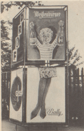
Sachen gibt es!