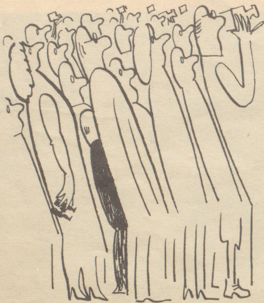
Pisa, schiefer Turm