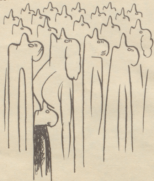
Dom zu Mailand